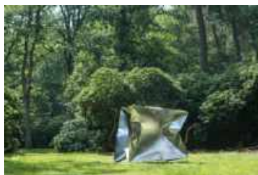
Ewerdt Hilgemann, Cube (KMM), vacuüm getrokken, roestvrij stalen kubus van 2 x 2 x 2 meter