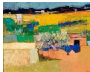
Willem Oepts, Landschap, Zuid Frankrijk, 1971, Olieverf op doek 65 x 81