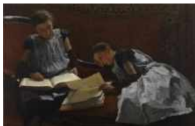
Willem Bastiaan Tholen – De gezusters Amtzenius, 1895, olie op doek 36,5 x 57 cm